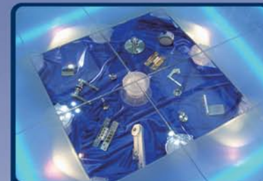
Прозрачные полы, подиумы